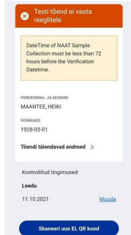
Juhendist p 4 näited