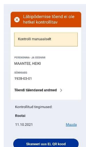
Juhendist 6 näide