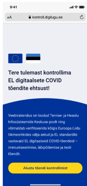
Juhendist p 1 vaade