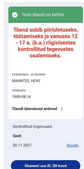
Juhendist p 3.1 näide