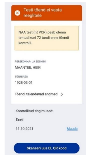
Juhendist p 3.2 näide